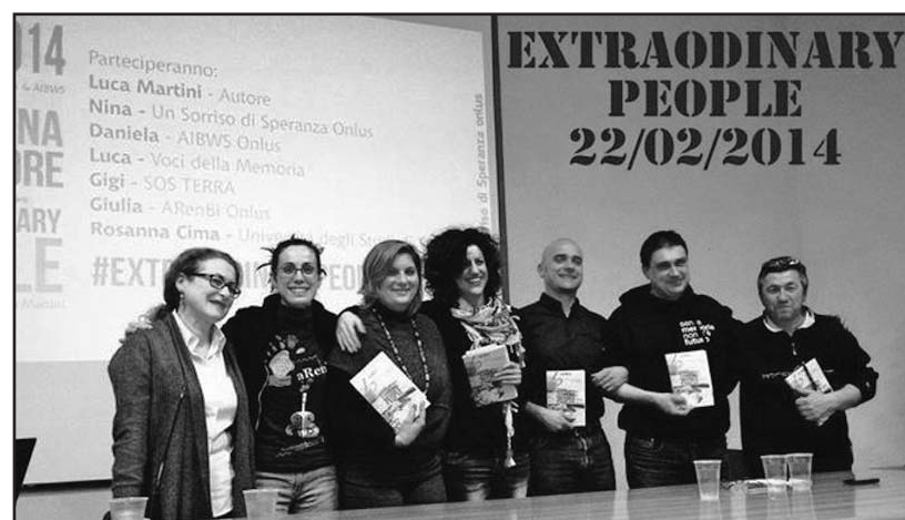
I relatori dell'incontro.

Ancora una volta, grazie a due associazioni di volontariato che