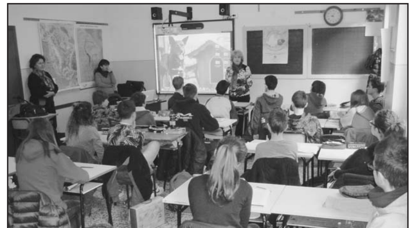
La presentazione alla Tovini Kolbe.