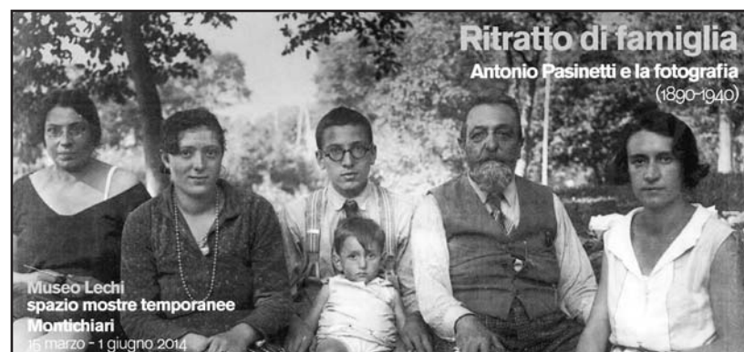
Museo Lechi spazio mostre temporanee Montichiari 15 marzo - 1 giugno 2014

La mostra rimarrà aperta dal 15 marzo al 1° giugno 2014; ingresso libero da mercoledì a sabato dalle ore 10-13/ 14,30-18 e domenica dalle 15 alle 19. Per ulteriori informazioni Montichiarimusei tel 030 9650455.