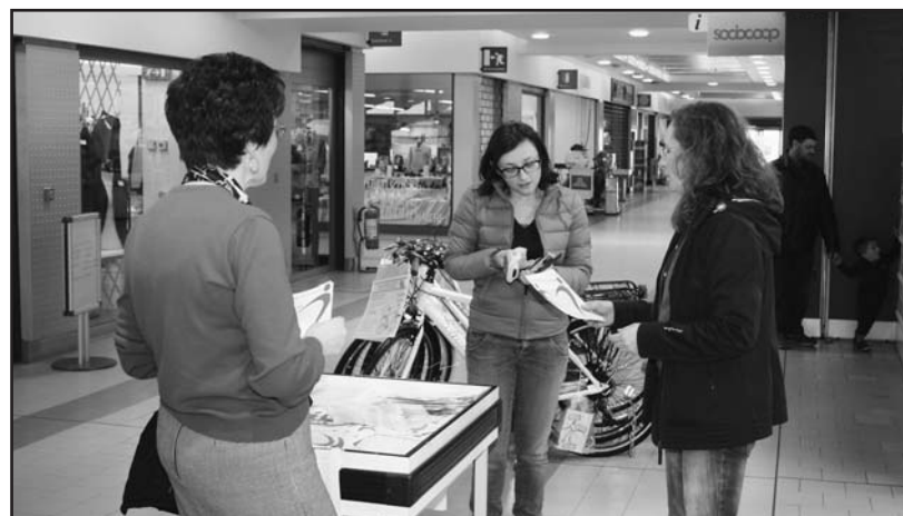
Volontarie presentano il progetto alla Coop.