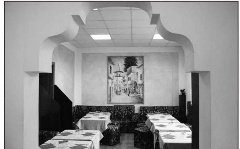
Ristorante tipico siriano con prodotti biologici.

PIATTI PER VEGETARIANI E VEGANI DOLCI TIPICI SIRIANI E VEGANI